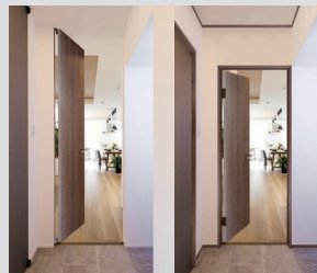
フルハイトドア®の空間 従来のドアの空間