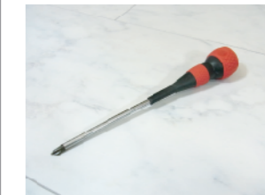
プラスドライバー