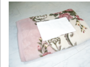
毛布又はバスタオル(2枚)